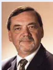
G. Jacques RÉGIS predsjednik IEC-a

IEC, ISO i ITU norme svjetskim vladama i gospodarstvu nude najbolja mjerila na koja se treba upućivati pri donošenju svih političkih odluka ili pri budućem sastavljanju sporazuma o klimi. Ove tri organizacije djeluju zajedno s drugim međunarodnim organizacijama kako bi osigurale da sudionici dolazeće Konferencije o klimatskim promjenama Ujedinjenih naroda, koja će se održati od 7. do 18. prosinca 2009. u Kopenhagenu, Danska, u potpunosti budu svjesni rješenja koja nude postojeće i buduće međunarodne norme.