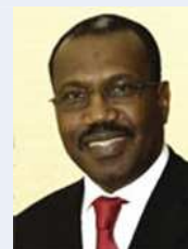
Dr. Hamadoun TOURÉ glavni tajnik ITU-a