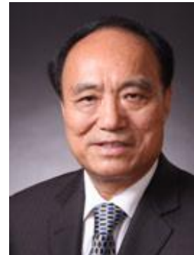
Houlin Zhao glavni tajnik ITU-a