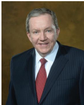
James M. Shannon predsjednik IEC-a

Ako su norme priznate i poštovane u cijelom svijetu, video kodiran na jednom uređaju moći će se dekodirati na drugom, bez obzira o kojim se uređajima radi. To vodi do ekonomije razmjera koja potiče rast tržišta, a time i povjerenje inovatora da vrijedi ulagati u nove videoaplikacije i usluge.